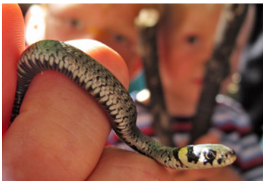
Auge in Auge mit einer Ringelnatter

Vom Donaudurchbruch bei Weltenburg bis zu Urwäldern und Hochmooren im Bayerischen Wald, von Orchideen im Labertal bis zu Feuersalamandern an der Isarleite: Die Naturschätze Niederbayerns sind vielfältig und beeindruckend. Und in allen niederbayerischen Landkreisen engagieren sich Ehrenamtliche beim LBV, um diese Naturschätze zu erhalten. Sie erwerben und pflegen wertvolle Flächen, unterstützen mit Nistkästen seltene Arten wie Fledermäuse und Schleiereulen oder helfen dabei, die illegale Verfolgung von Greifvögeln, Luchsen und anderen Tieren zu stoppen.