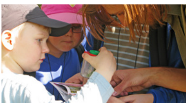
Mit Becherlupe und Bestimmungsbuch werden verschiedene Insekten erforscht

Auch das größte Schutzgebiet des LBV, der Rainer Wald, befindet sich in Niederbayern. Dort findet sich auf über 240 Hektar eine Vielfalt an Lebensräumen, die vielen teils seltenen Tieren und Pflanzen eine Heimat bieten. Trotz des Schutzstatus als Natura 2000-Gebiet und Naturwaldreservat ist das Betreten ausdrücklich erlaubt: Ein Lehrpfad führt zu den interessantesten Punkten und liefert Informationen zu den verschiedenen tierischen und pflanzlichen Bewohnern. Besucher können somit den Wald auf eigene Faust erkunden. Und natürlich bietet der Rainer Wald mit Wiesen, Bächen, Tümpeln und unterschiedlichen Waldgesellschaften ideale Bedingungen für die Umweltbildungsprogramme des LBV.