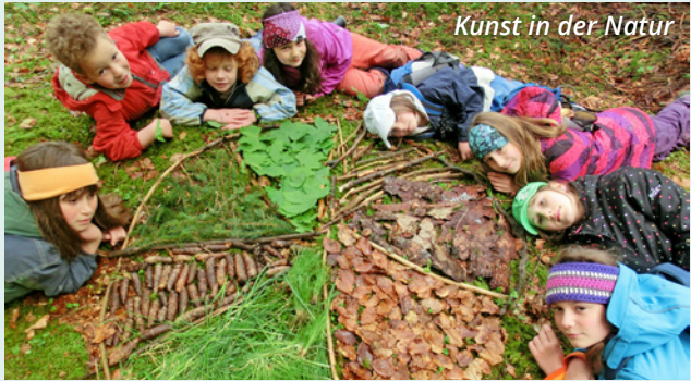
Kunst in der Natur

Der LBV erhebt und verarbeitet Ihre personenbezogenen Daten ausschließlich für Vereinszwecke. Dabei werden Ihre Daten nur für LBV-eigene Informations- und Werbezwecke verarbeitet und genutzt. Dieser Verwendung Ihrer Daten können Sie jederzeit, z.B. an mitgliedservice@lbv.de , widersprechen. Detaillierte Informationen zur Datenschutzerklärung des LBV finden Sie online unter: www.lbv.de/datenschutz