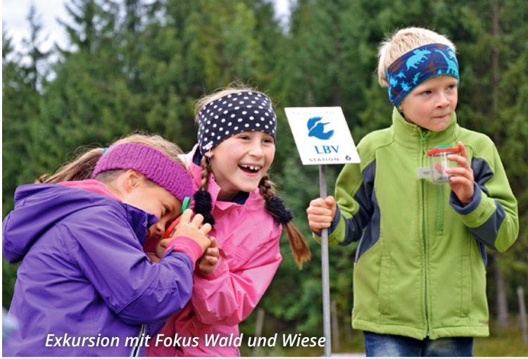
Exkursion mit Fokus Wald und Wiese

Die Angebote für Schulklassen werden von unseren LBV-Umweltbildungseinrichtungen vor Ort erarbeitet und durchgeführt. Weitere Informationen unter lbv.de/umweltstationen