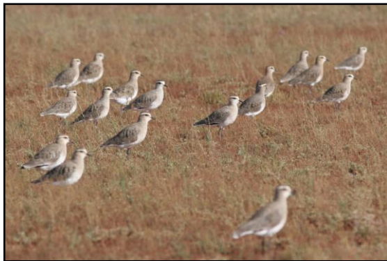
Ein Schwarm Steppenkiebitze sammelt sich nach der Brutzeit zum Zug

Wir alle waren sehr erleichtert, als es endlich logging und klar wurde, dass mit den Vögeln alles in Ordnung war und dass ihre Sender richtig funktionierten. Bemerkenswerterweise flogen alle drei unserer besenderten Vögel am gleichen Tag – Dienstag, den 17. September – ab.