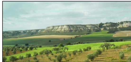
Olivenbäume in Spanien

Im Jahr 2015 beschäftigten uns bei der Landwirtschaft drei Themen: Umsetzung, Vereinfachung und Proteste.