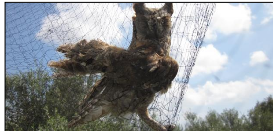
Gefangene Zwergohreule

27 BirdLife Partner aus dem gesamten Mittelmeerraum und Georgien haben Informationen für ein dringend notwendiges Forschungsprojekt gesammelt (lesen Sie den Bericht The Killing hier ). Man fand heraus, dass pro Jahr im Mittelmeerraum mehr als 25 Millionen Vögel – inklusive gefährdeter oder rückläufiger Arten wie Turteltaube , Spanischer Kaiseradler und Moorente – verbotenerweise getötet werden.