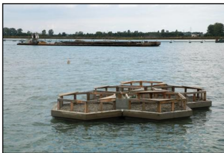
Von oben nach unten: die Flöße bei der Anlieferung, Einbringen ins Wasser, schwimmende Flöße

Im Herbst 2015 trafen sich Vertreter des LBV , Bayerns größtem Naturschutzverband und Partner des NABU (BirdLife in Deutschland) , im Werk Burglengenfeld von HeidelbergCement zu Gesprächen mit dem Betreiber. Zum einen brütet auf dem Werks-Schornstein der Wanderfalke, zum anderen ist der Steinbruch für seine ökologischen Projekte bekannt, die von Wissenschaftlern und örtlichen Schulen durchgeführt werden. Der LBV und die Betreiber einigten sich darauf, in dem Steinbruch ein Artenhilfsprogramm für seltene Amphibien durchzuführen. Dort kommt unter anderem die Gelbbauchunke vor.