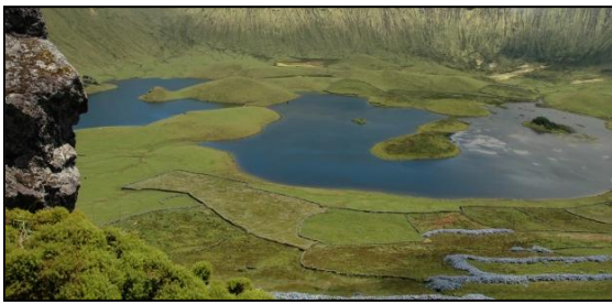
IBA in Caldeirao do Corvo, Portugal.

Im Jahr 2010 wurde die EU-Biodiversitätsstrategie bis 2020 verabschiedet. Sie verpflichtet die Europäische Kommission, das Europäische Parlament und die EU-Mitgliedsstaaten, Maßnahmen gegen den Biodiversitätsverlust und die Verschlechterung von Ökosystemleistungen zu ergreifen.