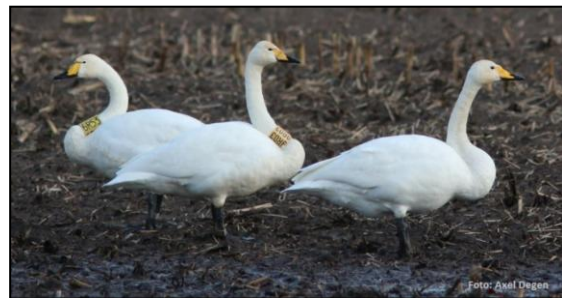
Beringte Singschwäne

Im Dezember erreichte uns außerdem aus Deutschland die Nachricht, dass Singschwäne aus dem Norden angekommen seien. Neue Daten zeigten, welche faszinierende Reise diese wunderschönen Vögel unternehmen. Ornithologen konnten die Datenlogger der Tiere auslesen, die im Rahmen eines gemeinsamen Projektes von HeidelbergCement und NABU besendert worden waren. Einer der Schwäne flog fast 1.500 km an einem einzigen Tag – vom Petchora Delta in Sibirien bis nach Deutschland!