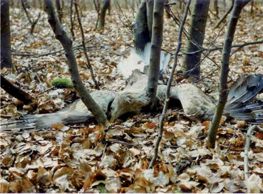
Vergifteter Seeadler. In den letzten Jahren wurden in Schleswig Holstein und Brandenburg zahlreiche Adler Opfer von Giftködern. Trotz intensiver Ermittlungen der Polizei wurde bis heute kein Täter verurteilt.

stände betroffener Arten ausgegangen werden. Dies gilt besonders für Arten mit ohnehin geringen Beständen oder lückenhafter Verbreitung, wie z. B. den Rotmilan, der als Nahrungsgeneralist besonders unter Vergiftungen zu leiden hat. Da in Deutschland mehr als die Hälfte des Weltbestandes dieser Art brüten, besteht hier eine besondere Verantwortung für den Erhalt dieses weltweit bedrohten Greifvogels.