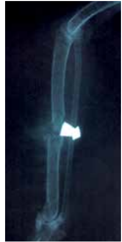
Mit einer Schrotflinte abgeschossener Mäusebussard. Die Bleikügelchen sind über den ganzen Körper verteilt.