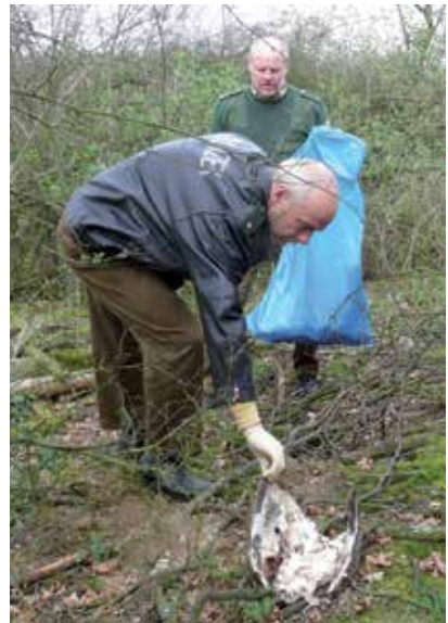
Bei Verdacht auf Vergiftung sind tote Vögel und verdächtige Köder wichtige Beweismittel.