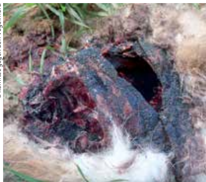
Bei diesem ausgelegtem Köder (Feldhase) ist das blau gefärbte Gift-Granulat gut zu erkennen.