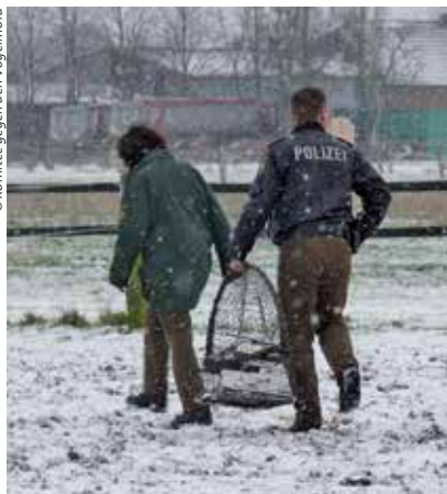
Polizisten stellen einen illegal aufgestellten Habichtfangkorb sicher.