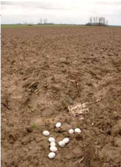
Mit einem Insektizid vergiftete Hühnereier und Schlachtabfälle, ausgelegt auf einem Acker.