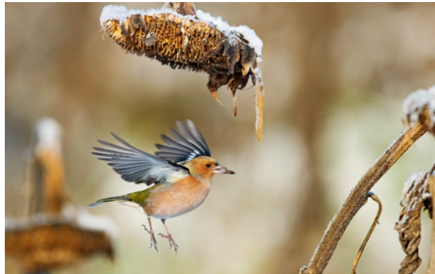
Buchfink von Michael Wintermayr, Sieger unseres Fotowettbewerbs zur Stunde der Wintervögel 2023 .

Vögel am Futterhäuschen, im Garten, auf dem Balkon oder im Park: Der LBV sucht deine schönsten Eindrücke aus der Natur im Siedlungsraum. Gewinne einen Platz für dein Foto im nächsten Falblatt.