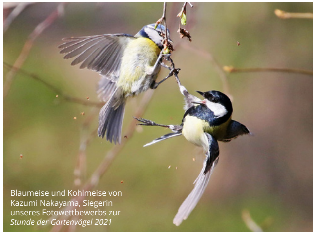
Blaumeise und Kohlmeise von Kazumi Nakayama, Siegerin unseres Fotowettbewerbs zur Stunde der Gartenvögel 2021