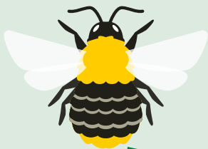
ACKERHUMMEL gelb-bräunlicher Hintern