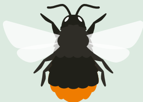
STEINHUMMEL orange-rötlicher Hintern