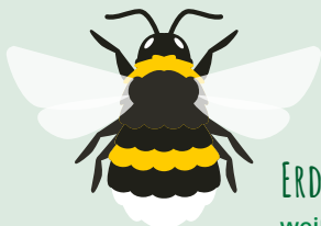
ERDHUMMEL weißer Hintern