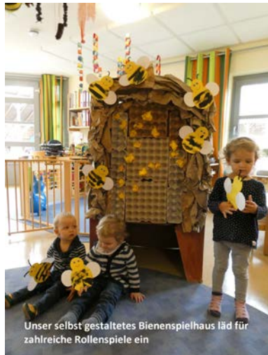
Unser selbst gestaltetes Bienenspielhaus lädt für zahlreiche Rollenspiele ein

97705 Burkardroth, St. Elisabeth Kindergarten Burkardroth, Steinbergstr. 44a