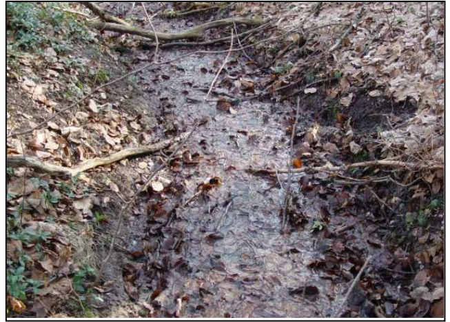
Zustand vor der Maßnahmenumsetzung: Absturz nach der Verrohrung (links), Bachlauf nach der Maßnahmenumsetzung (rechts)