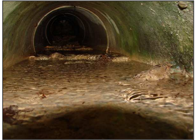
Zustand vor der Maßnahmenumsetzung: Verrohrung des Quellbachs (links), Betonrohr von innen (rechts)