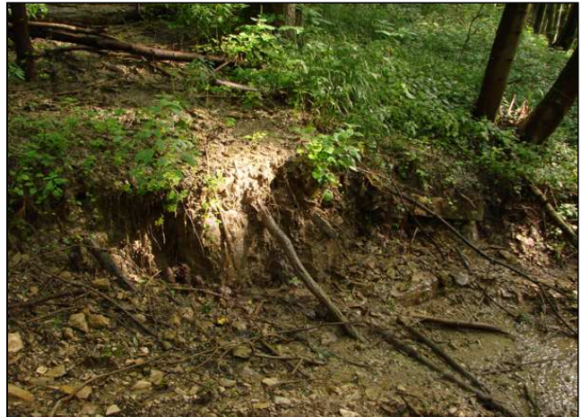
Zustand vor der Maßnahmenumsetzung: Beeinträchtigung des Quellbachs durch zunehmende Befahrung (links), Kalktuffbildung (rechts)