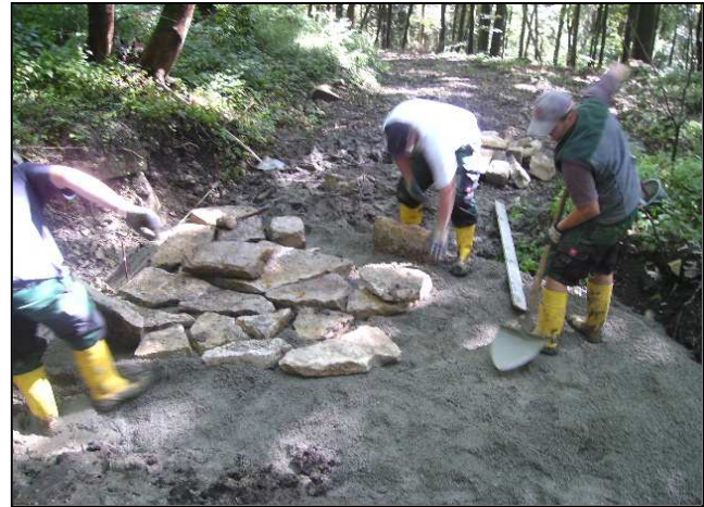
Maßnahmenumsetzung: Hilfsleitung und Beginn des Furtenbaus (links), Gestaltung der Furt (rechts)