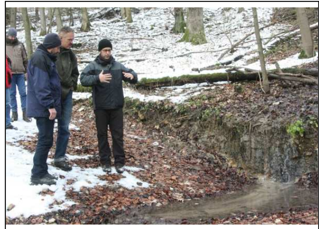
Zustand nach der Umsetzung: Furt nach der Umsetzung (links), Besichtigung bei der Abschlussbereisung im November 2007 (rechts)