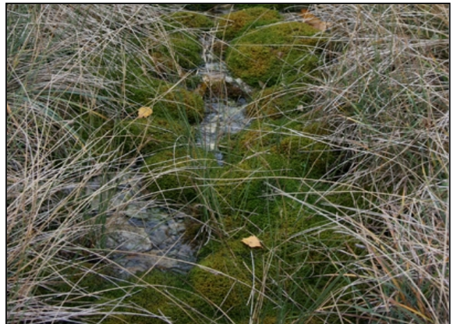
Zustand nach der Maßnahmenumsetzung: Zaun um die Quelle (links), Moospolster erholen sich wieder (rechts)