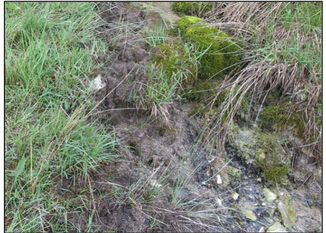
Zustand vor der Maßnahmenumsetzung: Trittschäden durch Beweidung im Quellbereich (links), zertretene Kalkuffbereiche (rechts)