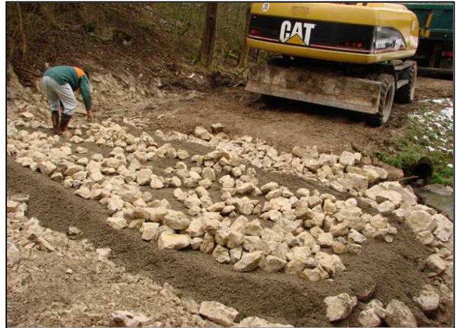
Maßnahmenumsetzung: Bau der Furt – Tragschicht (links) und Gestaltung der Oberfläche (rechts)