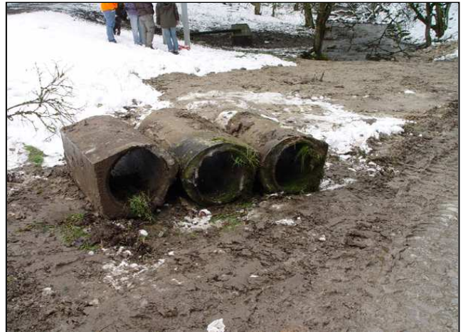
Maßnahmenumsetzung: die letzte Bauphase (links), beseitigte Betonrohre (rechts)