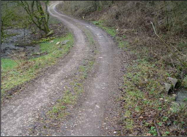
Zustand vor der Maßnahmenumsetzung: Verrohrung des Quellbaches