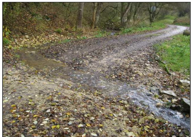
Zustand nach der Maßnahmenumsetzung: Furt unmittelbar nach der Umsetzung (links) und sechs Monate danach (rechts)