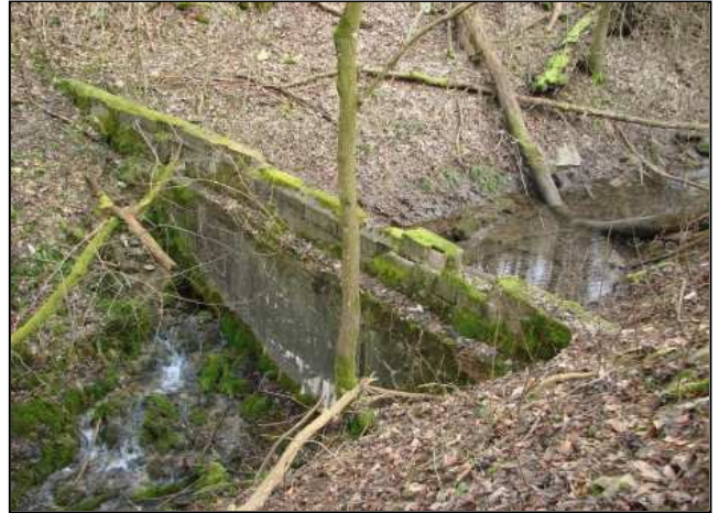
Zustand vor der Maßnahmenumsetzung: Anstauung des Quellbachs durch eine Betonmauer