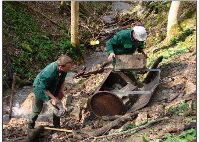
Maßnahmenumsetzung: Beseitigung der Mauer war mit hohem Arbeitsaufwand verbunden