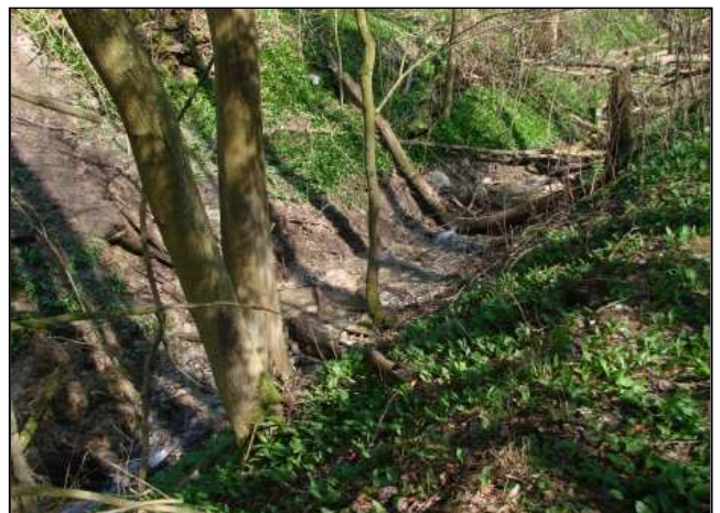
Zustand nach der Maßnahmenumsetzung: Standort unmittelbar nach dem Rückbau der Staumauer