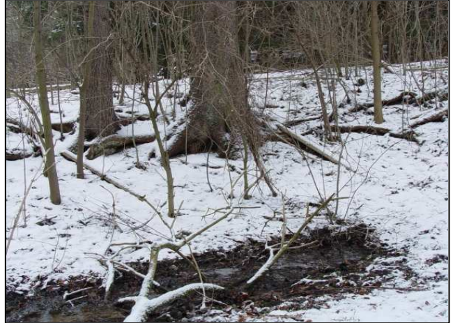
Zustand vor der Maßnahmenumsetzung: Fichtengruppen im Quellbereich (links und rechts)