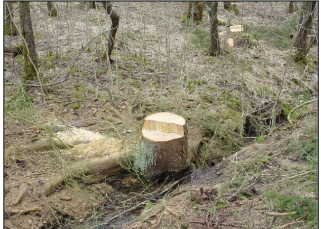
Maßnahmenumsetzung: Fichtenentnahme aus dem Quellbereich – vorher (links), nachher (rechts)