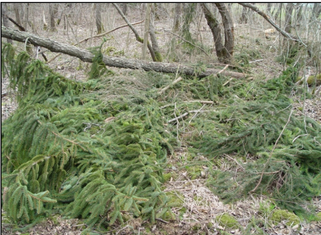
Maßnahmenumsetzung: hoher Aufwand bei Beseitigung der Kronenreste (links)