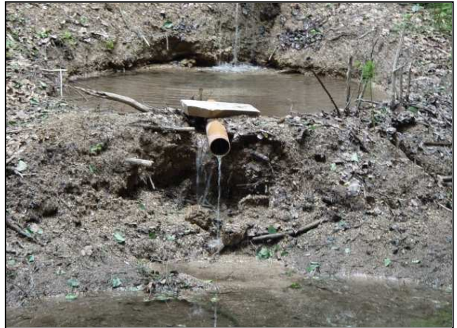
Zustand vor der Maßnahmenumsetzung: Anstauung des Quellbach (links), Fischeiche (rechts)