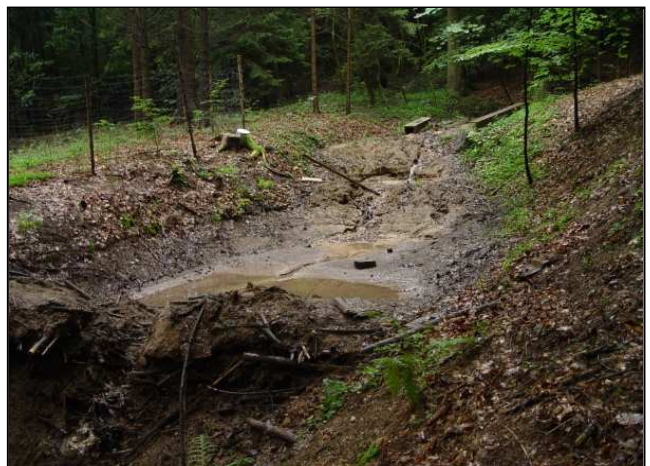
Zustand nach der Maßnahmenumsetzung: Quellbereich nach der Fichtenentnahme (links), aufgelassene Fischeiche (rechts)