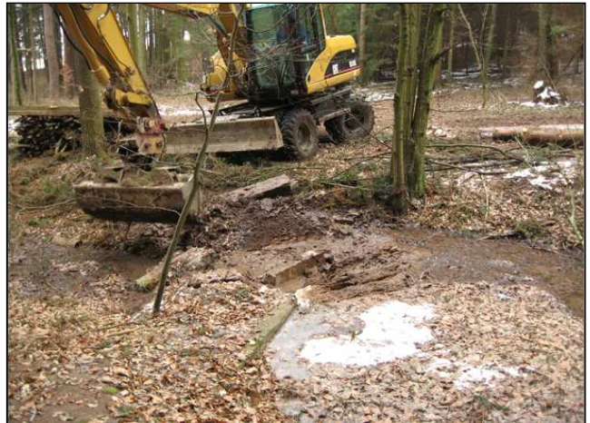
Maßnahmenumsetzung: Fichtenentnahme im Quellumfeld (links), Beseitigung der Verbauungen im Quellbach (rechts)