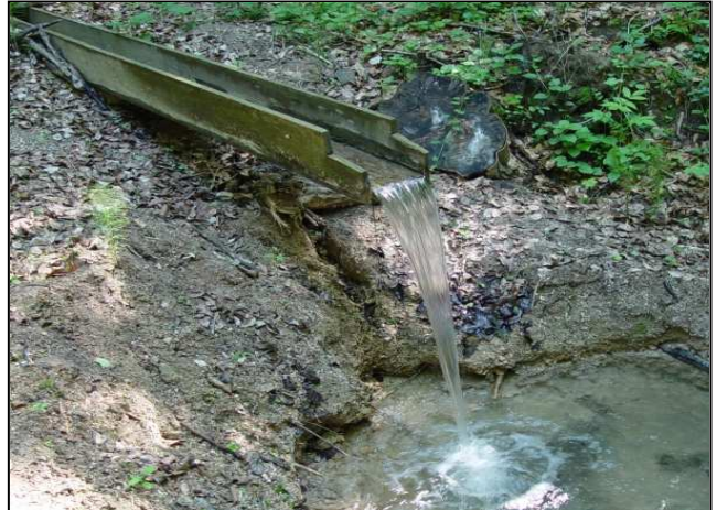
Zustand vor der Maßnahmenumsetzung: Ablagerungen im Quellbereich (links), Verbau im Quellbach (rechts)