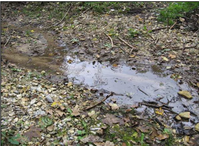
Zustand nach der Maßnahmenumsetzung: Furt sechs Monate nach der Umsetzung