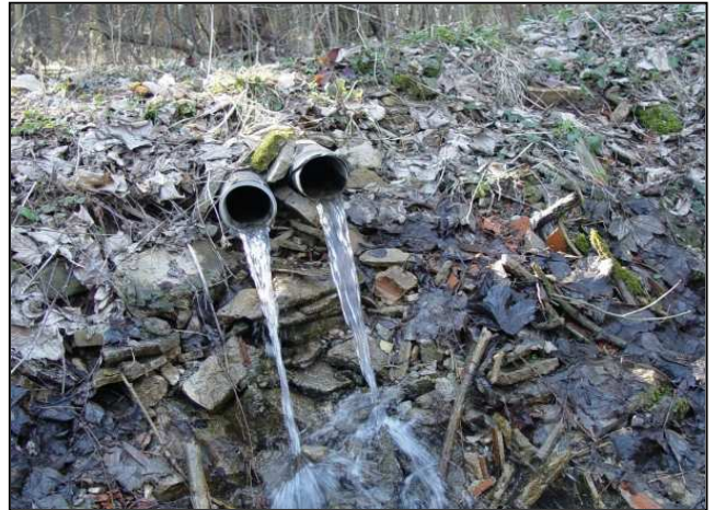
Zustand vor der Maßnahmenumsetzung: Verrohrung des Quellbaches (links und rechts)