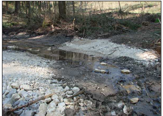
Zustand nach der Maßnahmenumsetzung: Furt zwei Wochen nach der Bauphase (links und rechts)