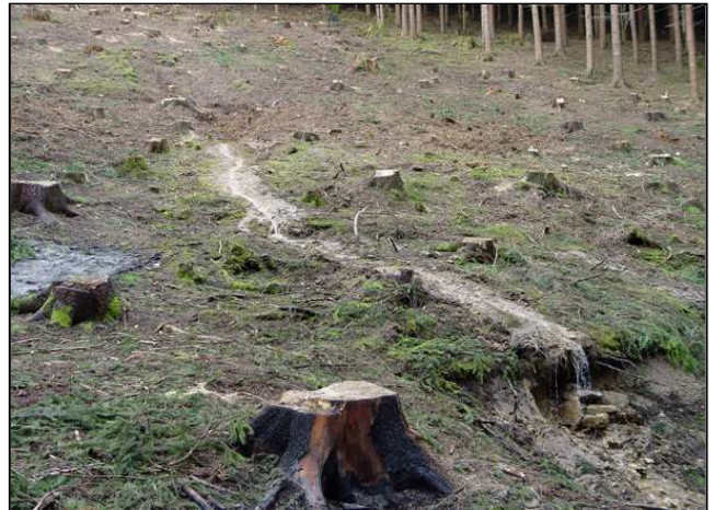
Maßnahmenumsetzung: Kronenmaterial wurde unterhalb des Quellbereichs verbrannt (links), Ergebnis der Maßnahme (rechts)