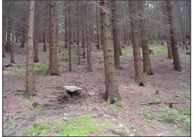
Zustand vor der Maßnahmenumsetzung: Quellfassung (links), Fichtenforst (rechts)