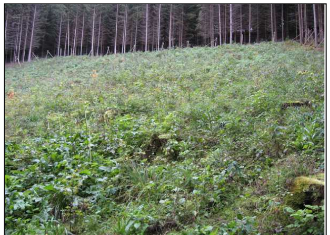
Zustand nach der Maßnahmenumsetzung: unmittelbar nach der Fichtenentnahme (links), Fläche nach einem Jahr (rechts)