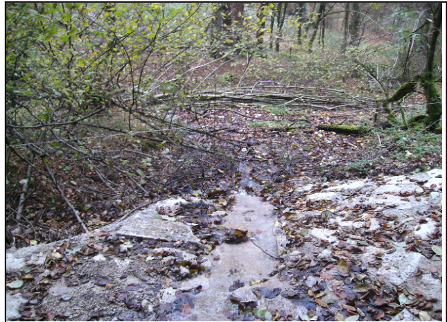
Zustand nach der Umsetzung: Furt nach der Umsetzung (links), neuer Abfluss (rechts)