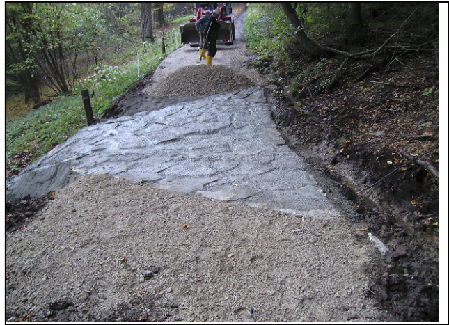
Maßnahmenumsetzung: Gestaltung der Furt (links), Abschluss der Bauphase (rechts)