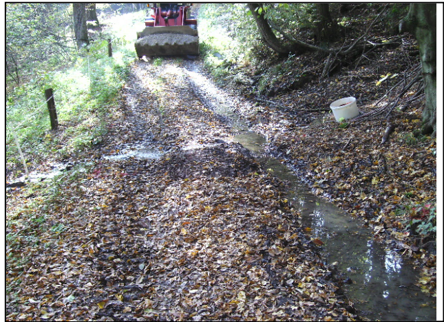
Zustand vor der Maßnahmenumsetzung: Quellabfluss durch die Befahrung stark beeinträchtigt, alte Verrohrung eingebrochen (links und rechts)