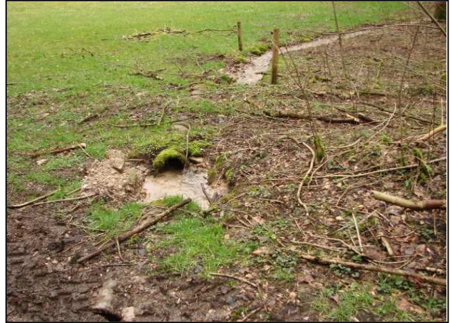
Zustand vor der Maßnahmenumsetzung: Verrohrung des Quellabflusses (links und rechts)