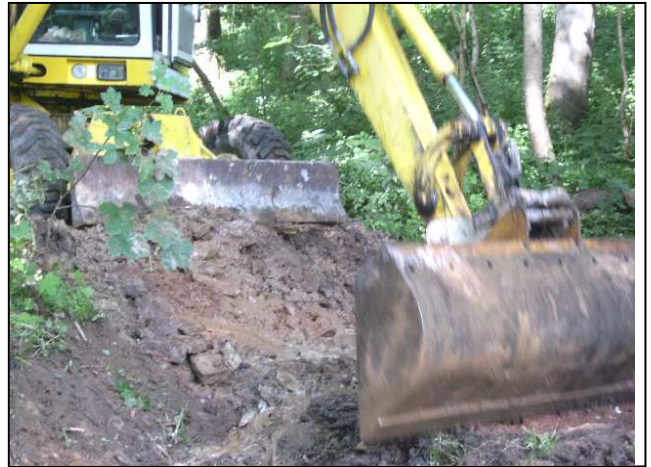
Maßnahmenumsetzung: Abklärung der Maßnahme vor Ort (links), erste Bauphase (rechts)