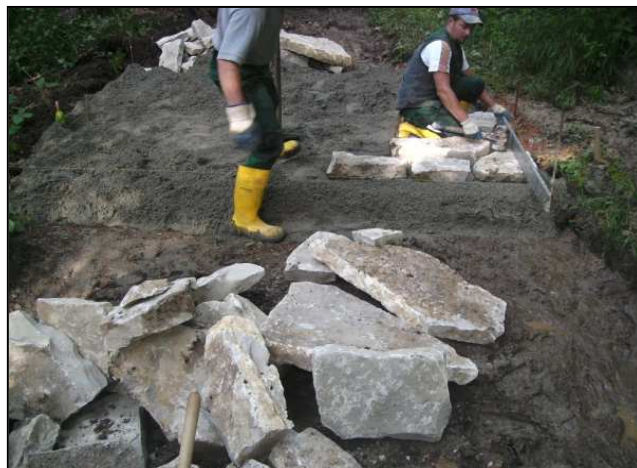
Maßnahmenumsetzung: Einbau der Hilfsleitung vor dem Furtbau (links), Gestaltung der Furt (rechts)