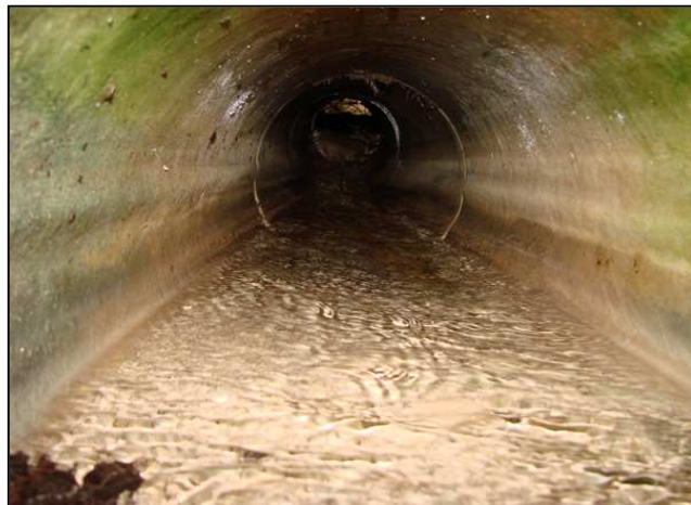
Zustand vor der Maßnahmenumsetzung: Verrohrung des Quellabflusses (links), Abfluss im Rohr (rechts)