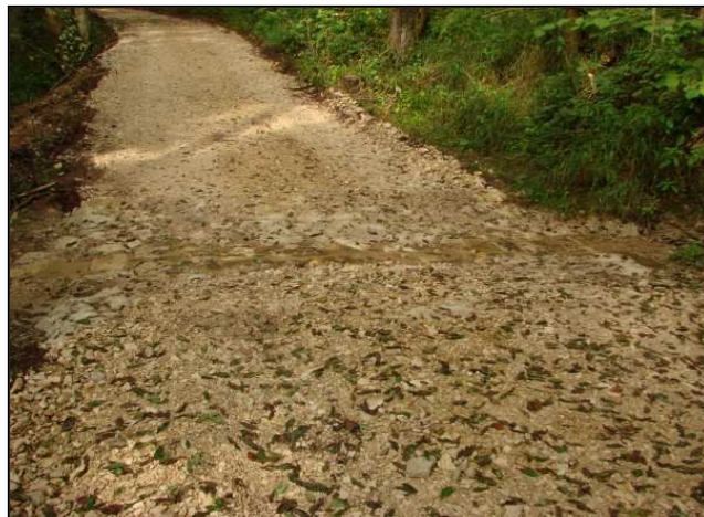
Zustand nach der Umsetzung: Furt 1-12 nach der Umsetzung (links), Furt 1-12a nach der Umsetzung (rechts)