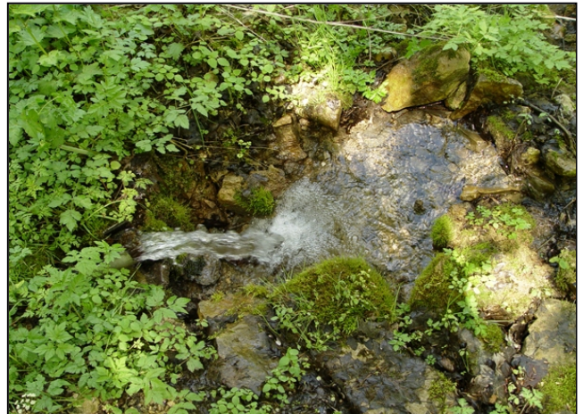
Zustand vor der Maßnahmenumsetzung: Verrohrung des Quellabflusses (links), Absturz nach dem Rohr (rechts)