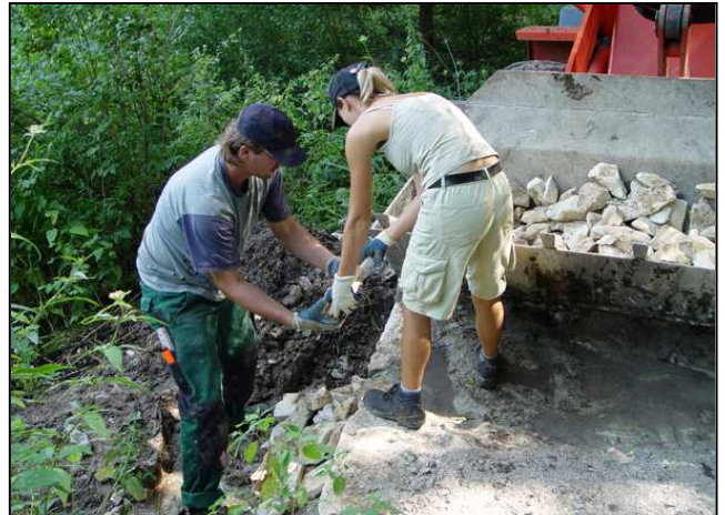
Maßnahmenumsetzung: Gestaltung der Furten (links) und des Abflussbereichs nach der Furt (rechts)