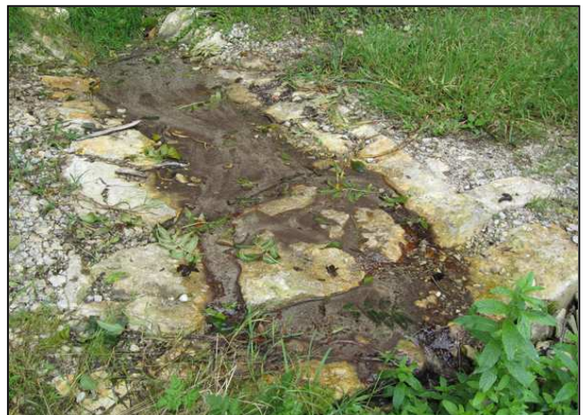
Zustand nach der Umsetzung: Furten ein Jahr nach Umsetzung – typisches Quellbachsubstrat in der Furt (links und rechts)