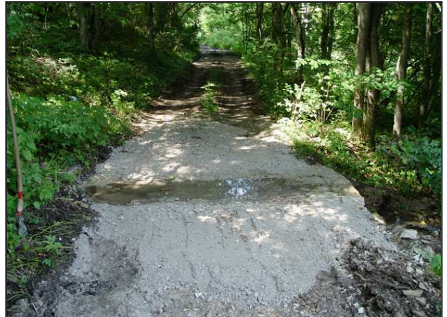
Maßnahmenumsetzung: Furt mit Hilfsleitung (links), gleiche Furt vor der letzten Bauphase (rechts)