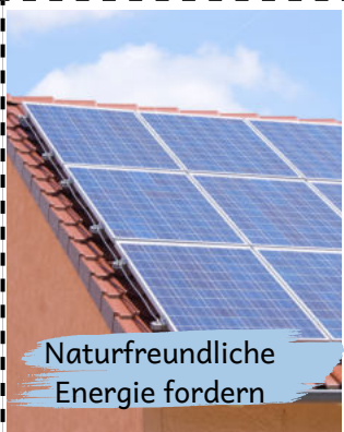
Naturfreundliche Energie fordern