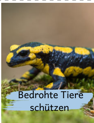
Bedrohte Tiere schützen