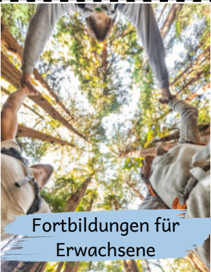
Fortbildungen für Erwachsene