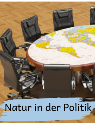
Natur in der Politik