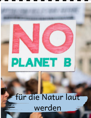
für die Natur laut werden