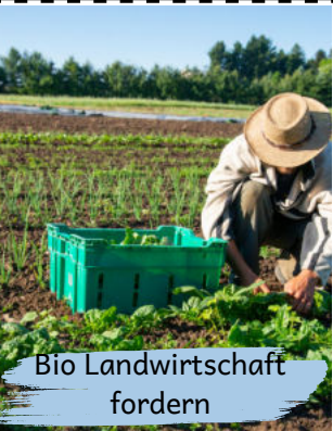
Bio Landwirtschaft fordern